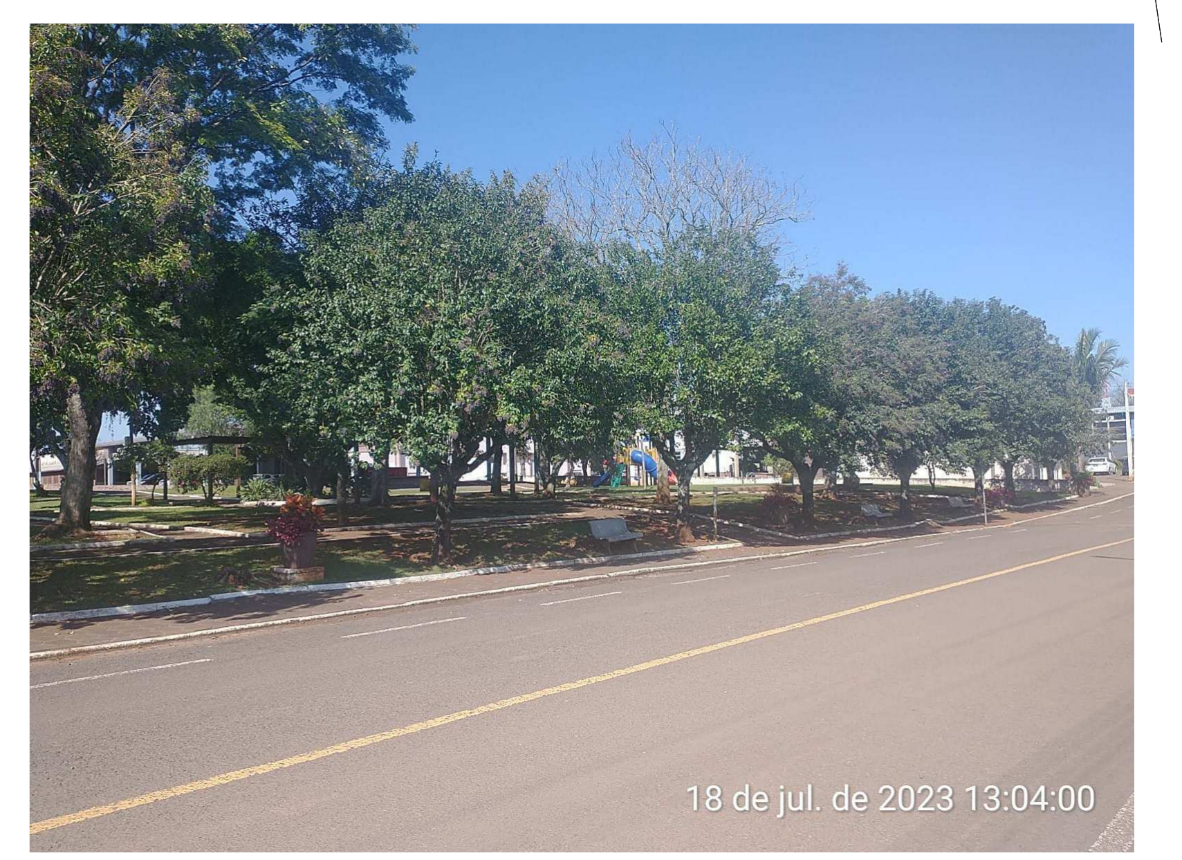
VISTA RUA SANTOS DUMONT