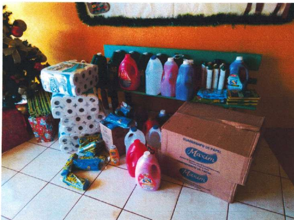
Descanso – SC, 13 de dezembro de 2024.