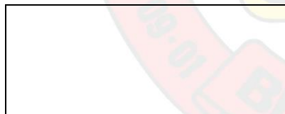
Jair Antônio Giumbelli Prefeito Municipal